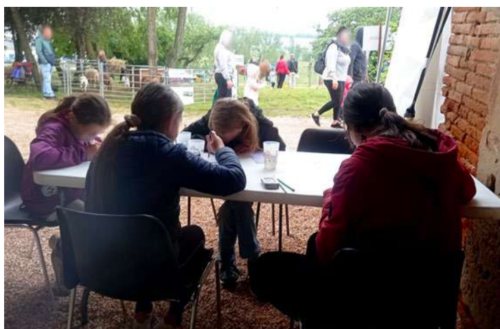
Atelier Aquarelle Naturaliste Salon Autour du Jardin (Castelnau-d'Estretfonds)