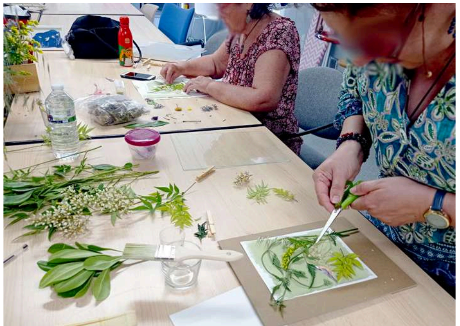
Atelier Cyanotype Médiathèque de Castelginest

Selon le cadre de l'atelier, la séance peut être précédée d'une cueillette des végétaux (promenade en forêt par exemple). Cela permet une expérience plus complète, une plus grande immersion dans la nature et l'univers botanique que propose déjà la pratique du cyanotype.