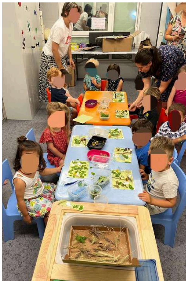
Atelier Cyanotype Association Les P'tits fontains (Castelnau-d'Estretfonds)

Ainsi, si vous avez en tête d'autres thématiques, d'autres sujets, n'hésitez pas à me contacter, pour que je vous propose, dans la mesure du possible, un atelier sur mesure correspondant à votre établissement ou à votre groupe.