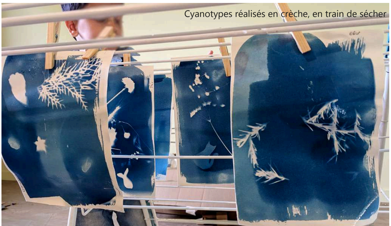
Cyanotypes réalisés en crèche, en train de sécher

A prendre en compte pour l'organisation : la composition avec les végétaux etc... avant l'exposition au soleil doit se faire dans un lieu le plus possible à l'abri des rayons du soleil, le produit commencerait à réagir et la feuille deviendrait donc bleue avant qu'on ait fini.